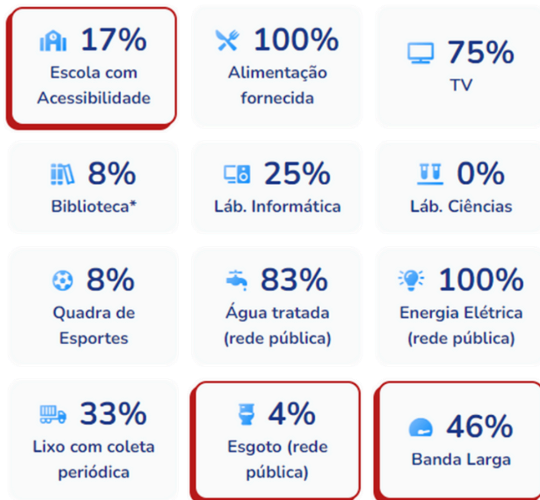
Figura 1 - Infraestrutura

Fonte: Qedu.org.br. Dados do Ideb/Inep (2019).